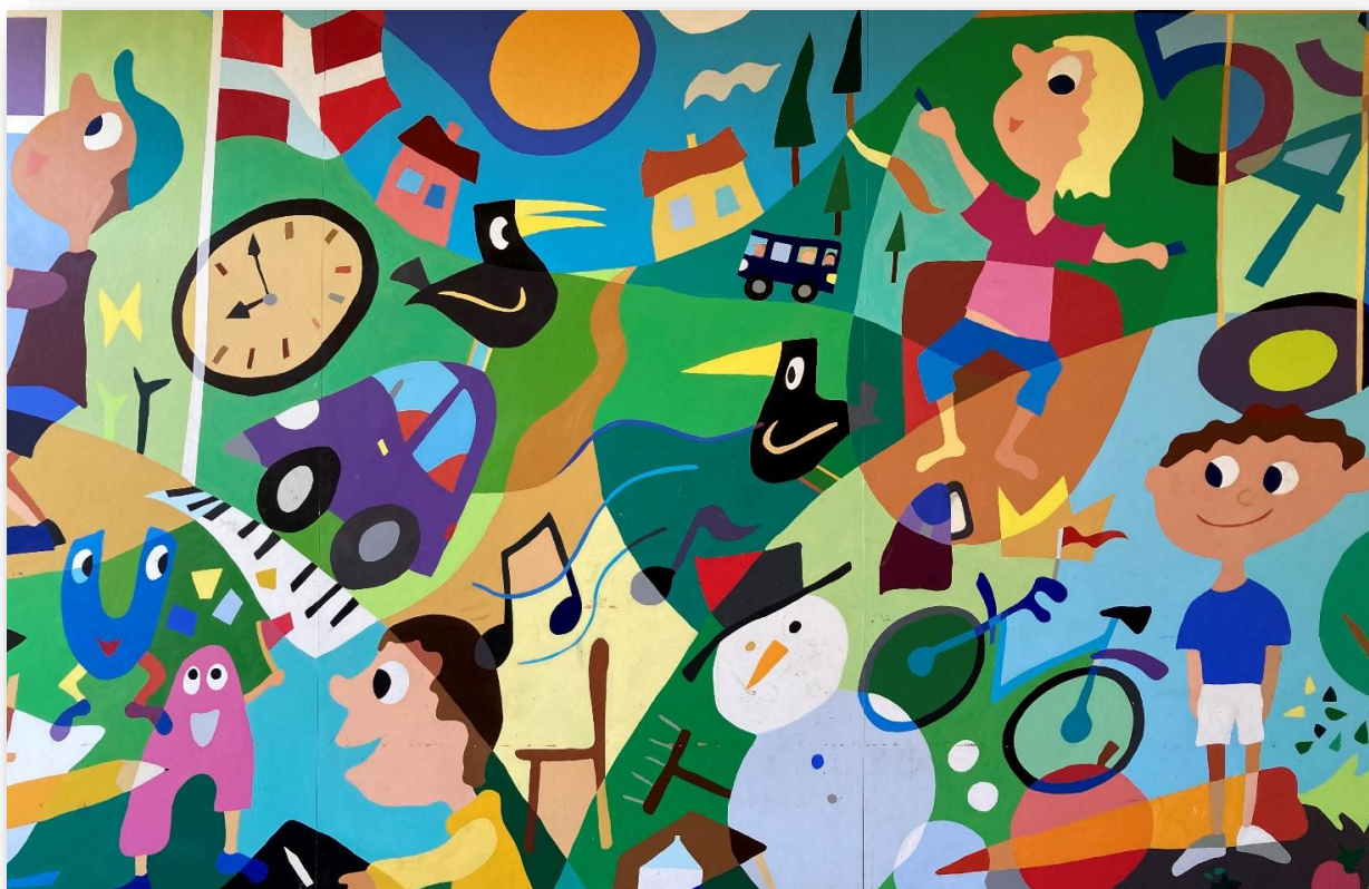
Malet af G R Ø M 2012