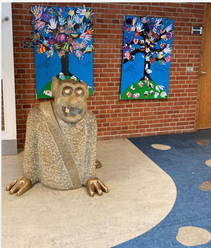
Lavet af billedhugger Erik Graeser